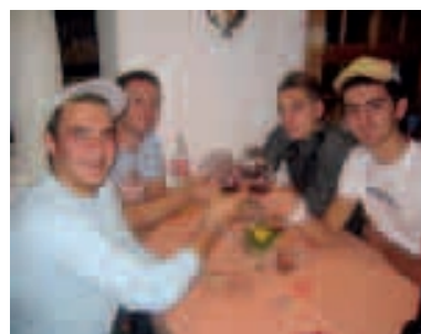
Spass beim Nachtessen

such in Davos und gaben den Lehrlingen die Gelegenheit, Wünsche und Verbesserungsvorschläge zu äussern, wobei einige Probleme gelöst wurden. Nach den Gesprächsstunden gingen alle gemeinsam essen.